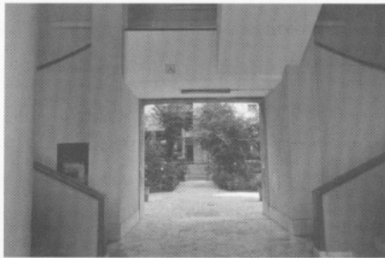
Sisäänkäynti Piazza Donna Olimpia 5:n sisäpihalle.

Via Donna Olimpian IFACP:n kolmen korttelin kokonaisuus on rakennettu kolmessa vaiheessa: Ensimmäisessä vaiheessa rakennettiin vuosina 1930-1932 Via Donna Olimpia 30:n kortteli, jossa oli 534 asuntoa 1800 asukkaalle. Toinen rakennusvaihe on Piazza Donna Olimpia 5, jonka kortteli valmistui vuonna 1938. Se sijoittuu V-muotoisena kahden kadun (Via Paola Falconieri ja Via Oznam) väliin ja sen näyttävää kaarevaa sisäpihaa dynaamisine parvekelinjoineen käytetään usein tv-sarjojen lavasteina. Kolmas rakennusvaihe, Via Donna Olimpia 56:n kortteli, valmistui vasta