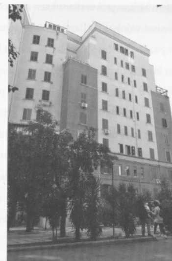
Kadunvarren ja pääpihan korkeat ja pitkät julkisivupinnat oli rytmitetty keltaokriin suorakaiteisiin, joita reunistivat punaokrat pystypalkit. Alun perin voimakkaat värit ovat huuhtoutuneet pois, mutta kirkkaat värinäytteet löytyvät yhä ikkunoiden alta