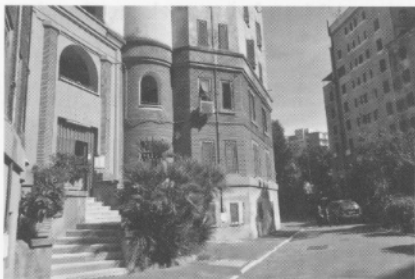
Näkymä Via Donna Olimpia 30:n pääpihalla kadun suuntaan.

ihanteeseen. Uudet lähiöt sijaitsivat kaukana 5-10 km päässä keskustasta ja ne jäivät pitkäksi aikaa ilman asianmukaisia palveluita. Ne, joilla oli varaa, jäivät keskusta. Muutto lähiöihin tuntui rangaistukselta keskustan kaupunkielämään tottuneille.