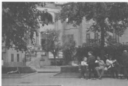
Sabbatinin korttelia leimaavat vehreiden sisäpihojen sarjat, jotka ovat asukkaiden ahkerassa käytössä.

Keskustan raivaustöissä asunnottomiksi jäänyttä väestöä siirrettiin Rooman lähiöihin. Via dei Fori Imperialin rakennusurakoitsija vastasi sopimuksen mukaan myös kaupunkilaisten uudelleen asuttamisesta. Fasistien ideologia piti kaupunkielämää turmiollisena puutarhakaupunkiaatteen kannattajia seuraten. Heidän ihanteenaan oli maanviljelijäteollisuustyöläinen, jonka pääelinkeino oli teollisuudessa ja sivutulo maanviljelyssä tai hän oli ainakin omavarainen elintarvikkeiden suhteen. Kaupungin laidalle rakennettavat vihreät asuinalueet vaikuttivat sopivan hyvin tähän