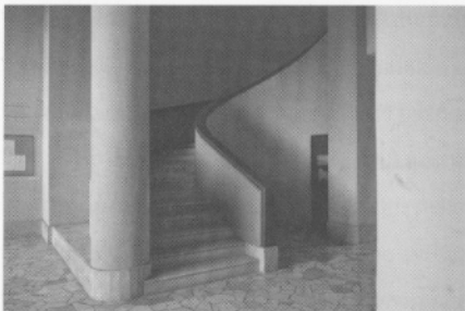
Sisäänkäyntiä reunustavat symmetrisesti elegantit portaat.

lähellä vuotta 1950, vaikka vanhat asukkaat muistavat leikkineensä sen perustuksissa koko 40-luvun. Kaksi viimeistä rakennusvaihetta ovat tyyllisesti samankaltaista rationalistista arkkitehtuuria.