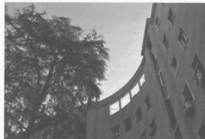
Italialaiseen rationalismiin kuuluvat viittaukset klassiseen arkkitehtuuriin.