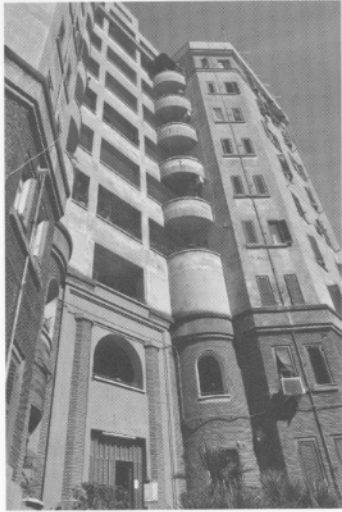
Sabbatinin runsain koristelu keskittyi porrashuoneiden sisäänkäyntien ympärille. Päällä olevat parvekkeet sen sijaan lähestyvät rationalistista arkkitehtuuria.

Puutarhakaupunki-aatteesta inspiroitunut vihreä asuinalue kasvoi San Saban kirkon ja Aurelianuksen muurin väliin. Aluksi nousivat kaksikerroksiset valoisat ja tilavat pari- ja rivitalot ja seuraavassa vaiheessa niitä ympäröivät kolme- ja nelikerroksiset kerrostalot. Pirani kehitti ekonominen koristelutavan, jossa pääasiassa rapatut julkisivut koristeltiin tiilistä tehdyillä klassisilla koristelustoilla ja pilastereilla viittaamaan renessanssin ja barokin arkkitehtuuriin. Samalla tiilinen julkisivukoristelu liitti uudet rakennukset materiaalinsa puolesta niin San Saba-kirkon tiilijulkisivuihin kuin Aurelianuksen muuriin. Nuoren arkkitehdin suunnitelma seurasi uusia eurooppalaisia arkkitehtuuri-ihanteita, mutta inspiroitui myös paikallisesta arkkitehtuurista. Kadut nimettiin mahtipontisesti Bramanten, Ligorion, Palladion, Berninin ja Borrominin mukaan.