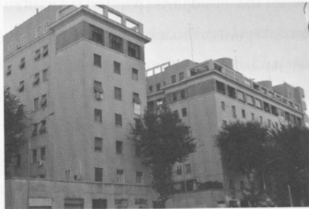
Katutason liikehuoneistojen välistä nouseaan sisäpihalle monumentaalisia portaita kahden jyrkän rakennusmassan välistä.

Niin kuin Val Melanian niin myös Via Donna Olimpian asuinlähiön viimeisin osa suunniteltiin fasismien aikana, mutta ne molemmat rakennettiin valmiiksi vasta sotien jälkeen. Via Donna Olimpia 56:ssa sisäpihalle nouseaan katutasosta monumentaalisia portaita, joiden ylätasoa koristavat sirot neliskanttiset pylväät palkkeineen. Alimman kerroksen julkisivu on kadun liikehuoneistojen puolella travertiinista, porraskäytävät ovat Carraran marmorista ja ylimmän kerroksen katujulkisivu on tiiltä. Piazza Donna