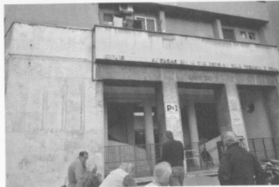
Piazza Donna Olimpia 5:n julkisivusta on sotien jälkeen poistettu fasistien tunnuksot eli kolme vit-sakimppua. Niiden paikat näkyvät kuvassa vasemmalla.

Kun vielä 1920-luvun loppupuolella roomalainen koulukunta oli luonut paikallisesta historiasta inspiroitunutta muotokieltä, Mussolinin alaisuudessa IFACP:n toimiston tyyli muuttui vuoden 1930 tienoilla kuin veitsellä leikaten lähemmäksi kansainvälistä modernismia. CIAM:n ( Congrès internationaux d'architecture moderne ) toisessa kokouksessa vuonna 1929 Frankfurtissa arkkitehdit olivat kiinnittäneet huomion minimiasumiseen ja ryhmä italialaisia arkkitehteja perusti vuonna 1930 rationalistisen arkkitehtuurin järjestön MIAR:n ( Movimento Italiano per l'Architettura Razionale ). Vuonna 1931 määriteltiin Rooman kaupungin uusi strategia asuttaa 12 lähiöön keskustan muutostöissä asunnottomaksi jääneet ja muut vähävaraiset. Fasistien sosiaalisen asuntotuotannon arkkitehtuurin haluttiin nyt ilmentävän järjestystä, kunniallisuutta, hygieniää ja nopeutta. Tyylinä suositettiin tästä lähtien yksinkertaista rationalistista tyyliä ( razionalismo ). Matalat parakkimaiset talot jätettiin kokonaan vaille koristelua, mutta korkeisiin kerrostaloihin suunniteltiin pelkistettyjä klassiseen arkkitehtuuriin viittaavia muotoaiheita kuten symmetrisesti aseteltuja pilastereita ja kaariholveja De Chiricon maalausten hengessä. Via Donna Olimpian