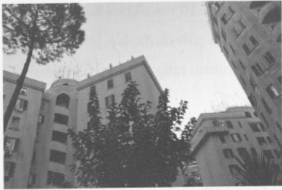
Rationalistisen Propellitalon keskellä on kierreporras, johon on merkattu rakennusvuodeksi sekä vuodet 1932 että 10.